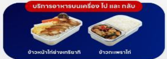
บริการอาหารบนเครื่อง ไป และ กลับ