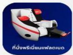
ที่นั่งพรีเมียมแฟลตเบด