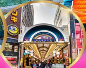
อิสระท่องเที่ยว 1 วันเต็ม หรือช้อปปิ้ง คาบุกิโคจิ